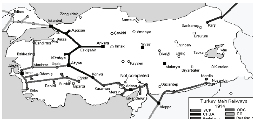
Схема 1. Карта железных дорог Турции накануне Первой мировой войны